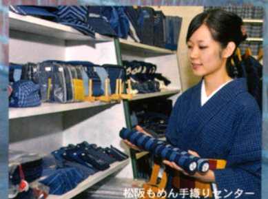
松阪もめん手織りセンター