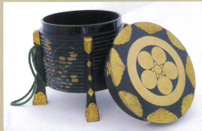
梅鉢紋入秋草蒔絵行器