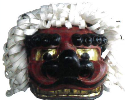
◀獅子頭(雄) 御厨神社 所蔵