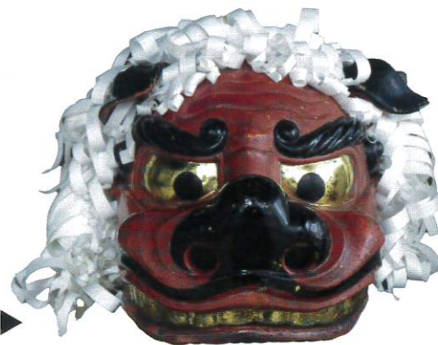
獅子頭(雌)▶ 御厨神社 所蔵

松阪の夏の風物詩・祇園祭は、「初午大祭」、「氏郷祭り」と並ぶ松阪三大祭のひとつで、毎年7月中旬に盛大に行われています。疫病退散を祈願したのがはじまりとされる祇園祭。その祭礼が、時代とともに移り変わる様子を貴重な資料を通してご紹介します。