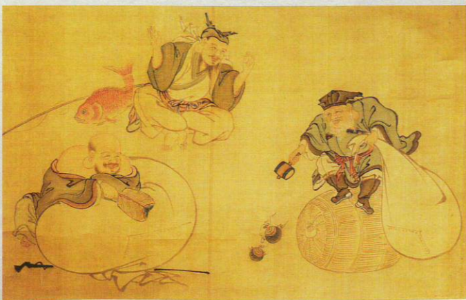
【三福神図】 江戸時代後期

商家長谷川家には、「鶴亀」や「松竹梅」、「恵比寿・大黒・寿老人」といった吉祥の意味をもつ図柄や文様を描いた品々が数多く伝えられています。本企画展では、同家に伝わるおめでたい品々を展示し、それらにこめられた吉祥の意味を読みといてご紹介します。