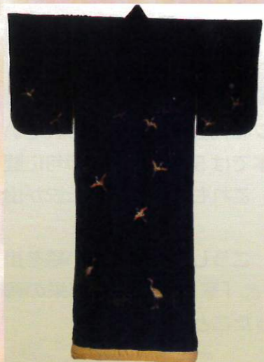
はなだじつのもよううちかけ 【縹地鶴模様打掛】 明治43年(1910)