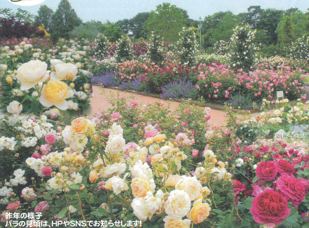
昨年の様子 バラの見頃は、HPやSNSでお知らせします!

【バラの育て方講座】 (初心者向け) 開催日時/5月11日(土) 11:00~ (約40分) 30分まえから受付開始 参加費/一般 500円 会員 300円 (オリジナル培養土 5L 付き) 定員/15名(当日先着順) 場所/イングリッシュガーデン内 グラスハウス