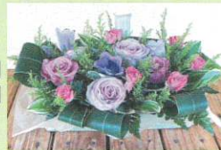
◎写真はイメージ ◎材料は写真とは異なります。