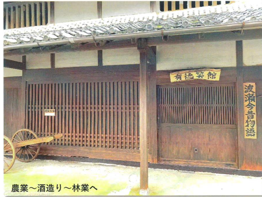
農業～酒造り～林業へ