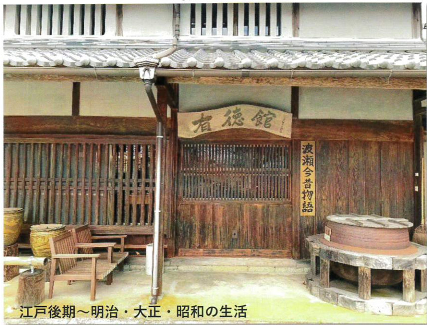
江戸後期～明治・大正・昭和の生活