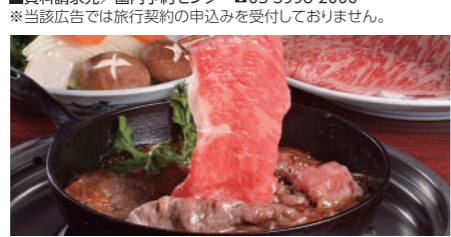
松阪牛すき焼き(イメージ)

いよいよ解禁! 旬の伊勢海老をはじめ、本場の松阪牛を専門店! 伊勢神宮は外宮・内宮・奥の院を順に参拝し、復路で観光特急「しまかぜ」に乗車する1泊2日プランです。 ■行程〔1日目〕東京(7:26～7:56発)◆新幹線こだま号◆品川・新横浜(途中乗車可)◆豊橋◆松阪(専門店松阪牛すき焼きの昼食)……松阪(歴史ある城下町を散策)◆志摩(海女小屋で豪快!海鮮焼物を堪能。旬の伊勢海老1匹付き)◆志摩・伊勢志摩ロイヤルホテル〔B〕〔泊〕※温泉露天風呂までごゆっくり〔2日目〕志摩◆伊勢神宮・外宮◆伊勢神宮・内宮(参拝・約3時間滞在でわおかげ横丁散策も自由昼食)◆奥の院◆宇治山田◆観光特急「しまかぜ」+++近鉄名古屋……名古屋◆新幹線ひかり号◆新横浜・品川(途中下車可)◆東京(19:43～20:23着) ■最少催行人員／25名、添乗員(TD)同行、バスガイド(BG)なし、相部屋不可、1名様より受付 ■旅行代金(おひとり)／東京駅から48,900円(2～5名1室) ※1名1室5,000円増し、名阪近鉄バスまたは同等(品川駅・新横浜駅から途中乗降可、同旅行代金)〈旅行代金に含まれるもの〉新幹線運賃・特急料金、貸切バス代、ホテル宿泊代、昼食代、諸税等 ■資料請求先／国内予約センター ☎03-5998-2000 ※当該広告では旅行契約の申込みを受付していません。