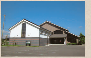
松浦武四郎 誕生地(生家)

【時】9:30~16:30【休】月曜日(祝日の場合翌日)・祝日の翌日・年末年始【料】大人310円、6歳~18歳200円(団体割引有)【交】伊勢中川駅→タクシー約7分【問】☎0598-56-6847