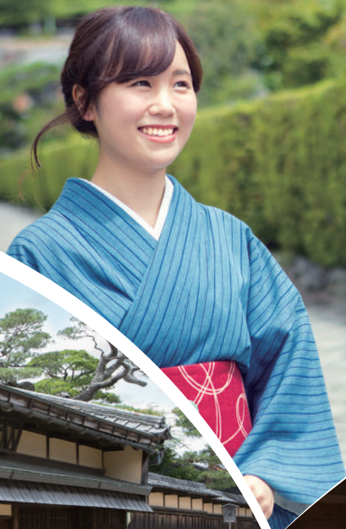
御城番屋敷 松坂城跡