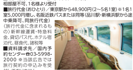
観光特急「しまかぜ」カフェ車両

いよいよ解禁! 旬の伊勢海老をはじめ、本場の松阪牛を専門店! 伊勢神宮は外宮・内宮・奥の院を順に参拝し、復路で観光特急「しまかぜ」に乗車する1泊2日プランです。 ■行程〔1日目〕東京(7:26～7:56発)◆新幹線こだま号◆品川・新横浜(途中乗車可)◆豊橋◆松阪(専門店松阪牛すき焼きの昼食)……松阪(歴史ある城下町を散策)◆志摩(海女小屋で豪快!海鮮焼物を堪能。旬の伊勢海老1匹付き)◆志摩・伊勢志摩ロイヤルホテル〔B〕〔泊〕※温泉露天風呂までごゆっくり〔2日目〕志摩◆伊勢神宮・外宮◆伊勢神宮・内宮(参拝・約3時間滞在でわおかげ横丁散策も自由昼食)◆奥の院◆宇治山田◆観光特急「しまかぜ」+++近鉄名古屋……名古屋◆新幹線ひかり号◆新横浜・品川(途中下車可)◆東京(19:43～20:23着) ■最少催行人員／25名、添乗員(TD)同行、バスガイド(BG)なし、相部屋不可、1名様より受付 ■旅行代金(おひとり)／東京駅から48,900円(2～5名1室) ※1名1室5,000円増し、名阪近鉄バスまたは同等(品川駅・新横浜駅から途中乗降可、同旅行代金)〈旅行代金に含まれるもの〉新幹線運賃・特急料金、貸切バス代、ホテル宿泊代、昼食代、諸税等 ■資料請求先／国内予約センター ☎03-5998-2000 ※当該広告では旅行契約の申込みを受付していません。