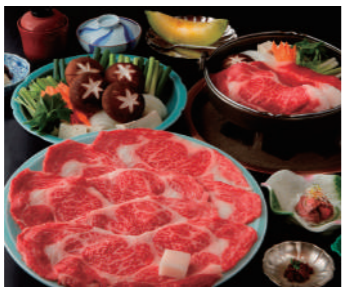
イメージ(写真は4人前)

■行程／発駅++(特急列車)++松阪駅……(徒歩約8分)……〔和田金/昼食「松阪肉焼き焼コース」〕……(徒歩)……松阪城下町散策……(徒歩)……松阪駅++(特急列車)++発駅 ■最少催行人員／2名 ■旅行代金／大阪難波駅から18,330円、近鉄名古屋駅から17,910円 ※他駅からの設定もございます(旅行代金に含まれるもの)近鉄運賃・特急料金、昼食代、諸税等