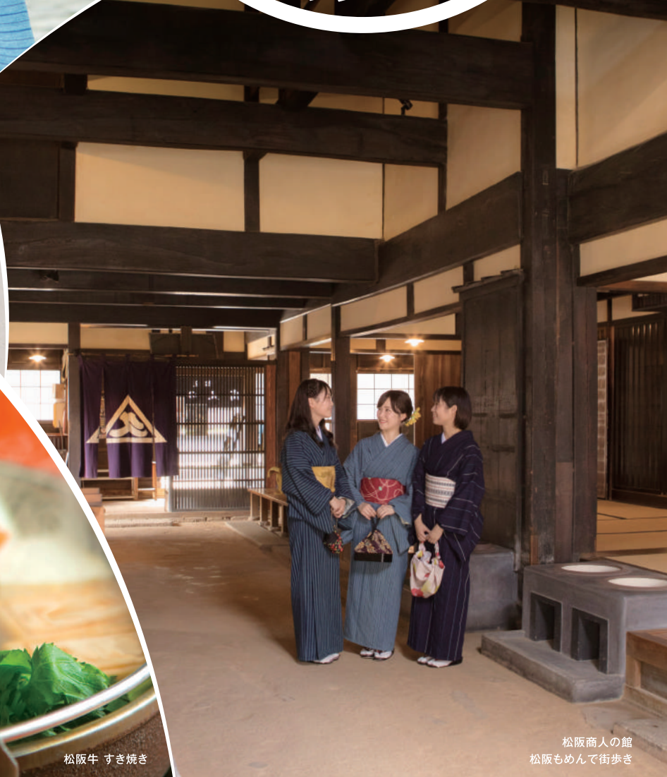
松阪商人の館 松阪もめて街歩き