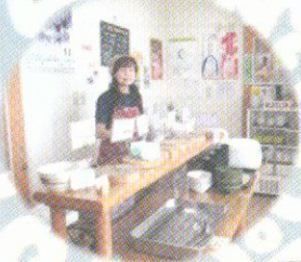
たぬみせ納豆工房