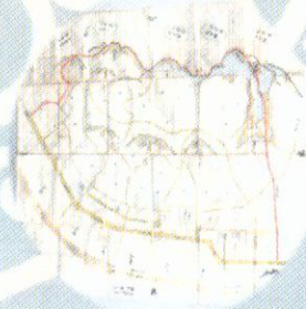
いざ〇我楽多資料館