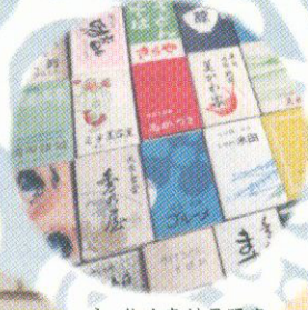
うつくしや東村呉服店