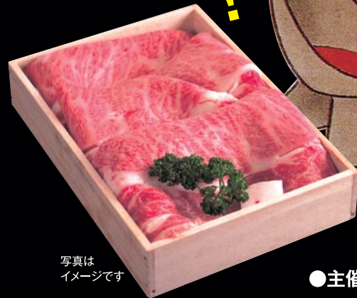
写真は イメージです