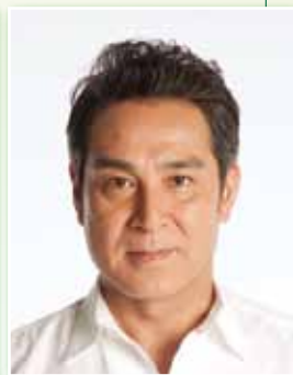
俳優 宇梶 剛士さん