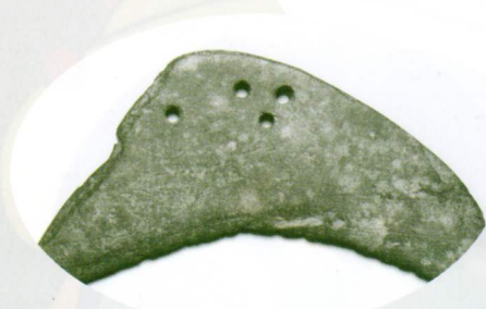
石包丁 (分れ谷遺跡)