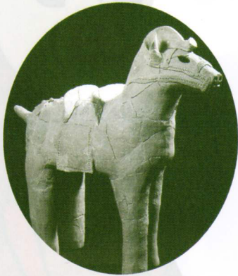
馬形埴輪 (常光坊谷4号墳)