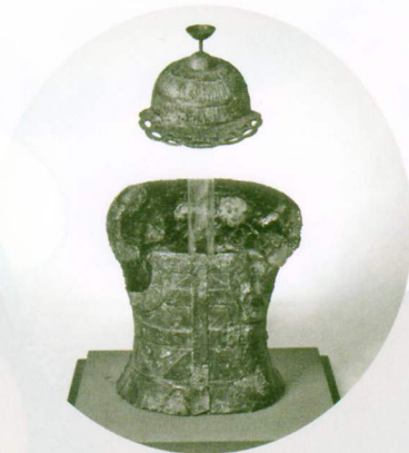
甲冑 (八重田古墳群)