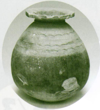
弥生土器 赤彩壺 (蛸遺跡)