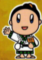
松浦武四郎 生誕200年記念事業 PR隊長 たけちゃん

本フォーラムは、みなさんとともに武四郎に「触れ」、武四郎を「語り」、武四郎を「知る」、いわば「武四郎の集い」です。武四郎に傾倒する著名人や研究者のお話を通して、武四郎の生き方を知り、考え方を探る機会となれば幸いです。