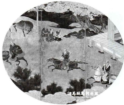
「調馬厩馬図屏風(多賀大社所蔵)」