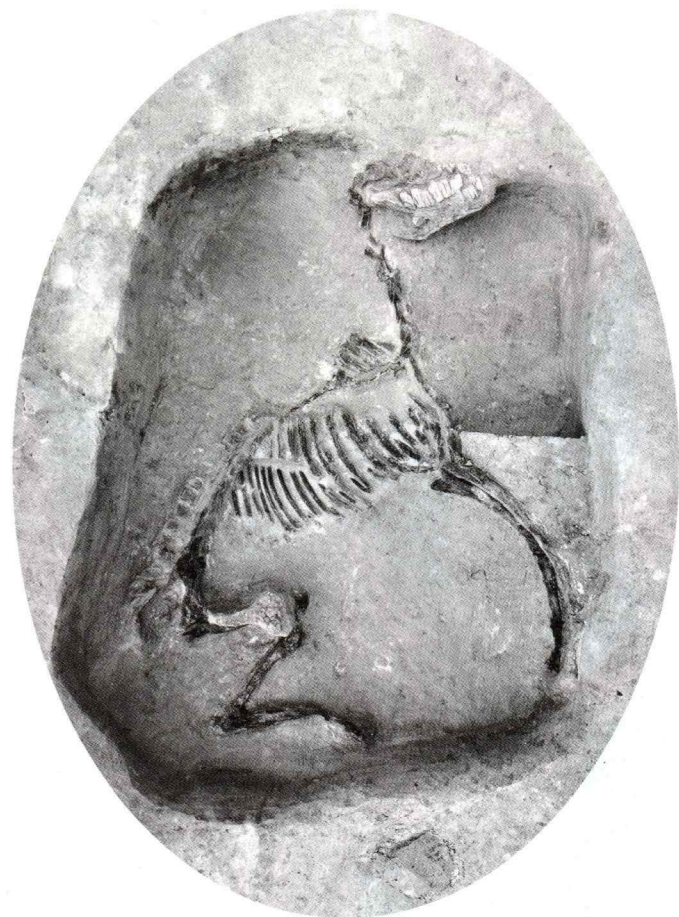
「〈大阪府指定有形文化財〉葎屋北遺跡出土 埋葬馬の出土状況(大阪府教育委員会所蔵)」

大昔、日本に馬はいませんでした。 古墳時代になり、馬は朝鮮半島から やってきます。 その後、日本では、馬は人々にとって 身近な存在となり、日本文化にも深く かかわってきました。 そんな「人とともに生きた“馬”」にス ポットをあててみました。