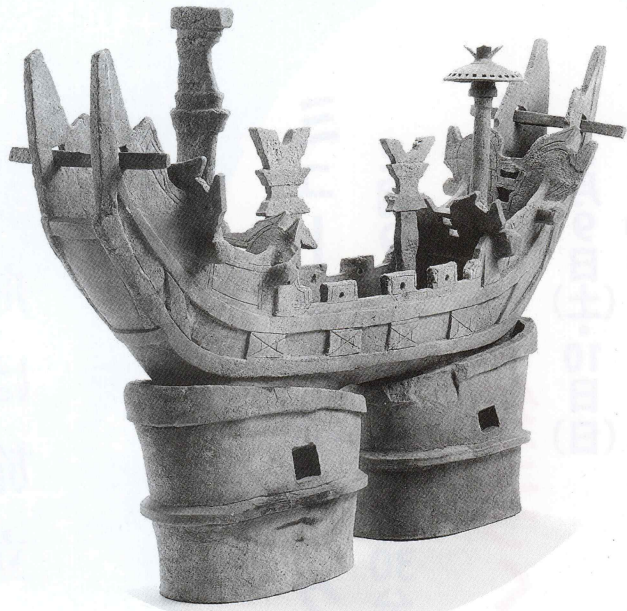
国重要文化財「埴輪 船」宝塚1号墳出土 (松阪市 所蔵)

宝塚1号墳で出土した船形埴輪には、 王の権力の象徴ととらえる考え方と、 魂をあの世へ送り届ける葬送の舟と とらえる考え方があります。 今回の展示では、葬送の舟との考え方に 基づき展示を行います。