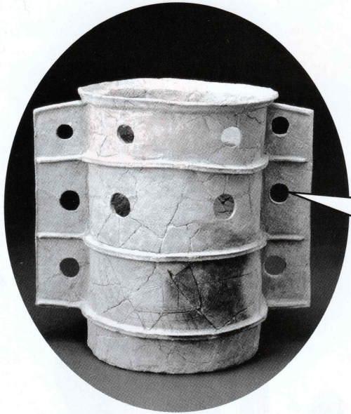
「鱗付き楕円筒埴輪」東殿塚古墳 出土 (天理市教育委員会 所蔵)

宝塚1号墳で出土した船形埴輪には、 王の権力の象徴ととらえる考え方と、 魂をあの世へ送り届ける葬送の舟と とらえる考え方があります。 今回の展示では、葬送の舟との考え方に 基づき展示を行います。