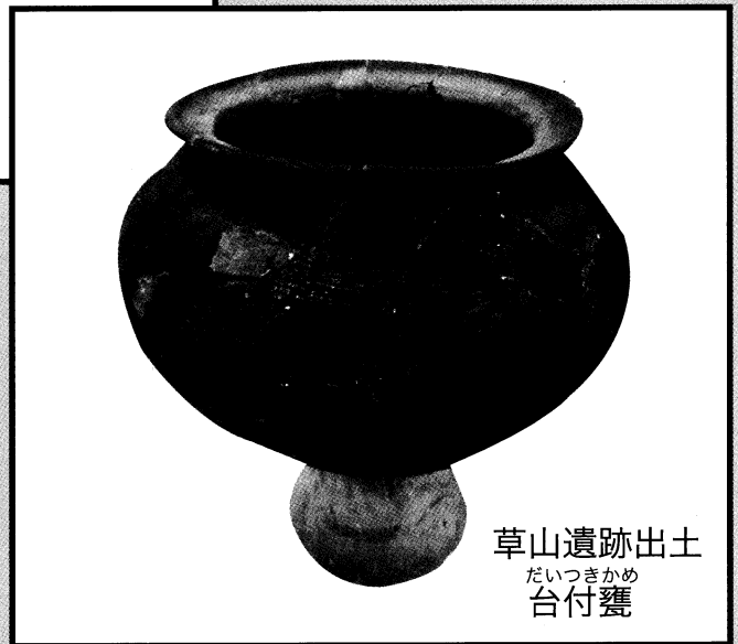
草山遺跡出土 だいつきかめ 台付甕