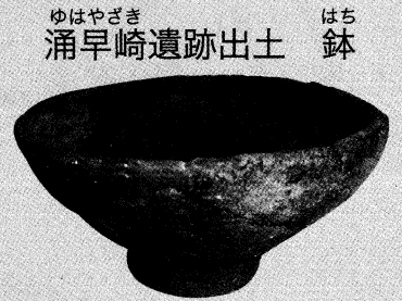
ゆはやざき 涌早崎遺跡出土 はち 鉢