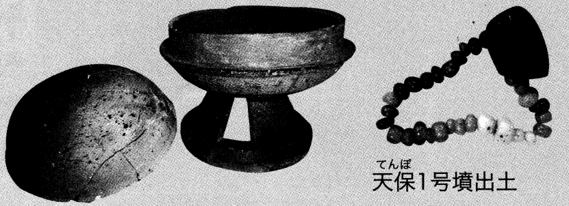
じょうこぼだに 常光坊谷古墳群出土 ふた たかつき 蓋、高杯