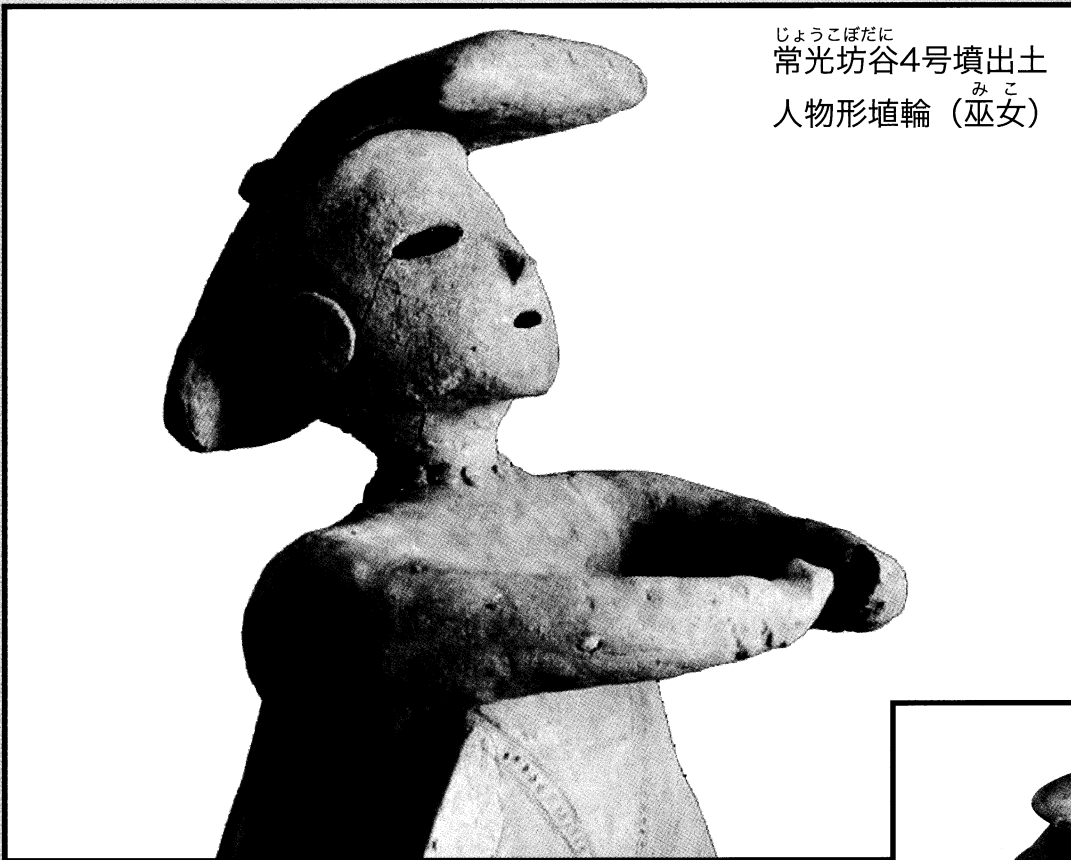
じょうこぼだに 常光坊谷4号墳出土 人物形埴輪 (巫女)