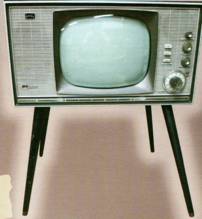
白黒テレビ (昭和35年)