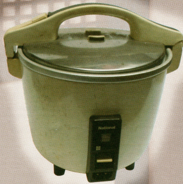
電気炊飯器 (昭和56年)