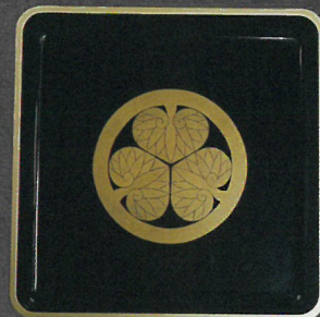
(三つ葉葵紋入広蓋)

※令和2年12月15日から令和3年2月14日までの間、まつさか手作り甲冑愛好会が作製した甲冑を展示します。