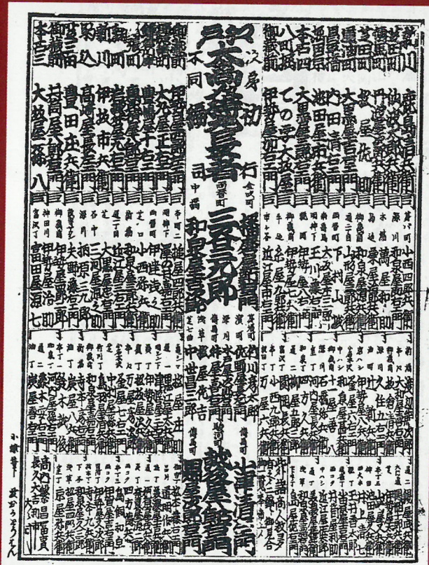
(江戸大商人持丸長者初編)