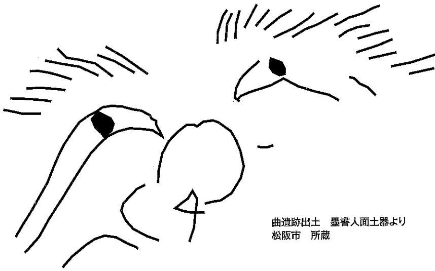
曲遺跡出土 墨書人面土器より 松阪市 所蔵

人の形をしていたり、人が描かれていたりする遺物が発掘調査等でみつかることがあります。土偶や人物埴輪、人形土製品などの人の形をした資料と、絵画土器や人面墨書土器などの人が描かれている資料を展示しています。時代によって変わる「人」の表現を見て楽しんでください。