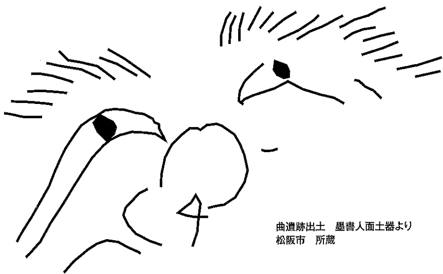
曲遺跡出土 墨書人面土器より 松阪市 所蔵

人の形をしていたり、人が描かれていたりする遺物が発掘調査等でみつかることがあります。土偶や人物埴輪、人形土製品などの人の形をした資料と、絵画土器や人面墨書土器などの人が描かれている資料を展示しています。時代によって変わる「人」の表現を見て楽しんでください。