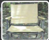
【ロースタイルチェア】