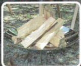
【ファイアディスク】