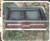
【コールマン バーベキューコンロ】