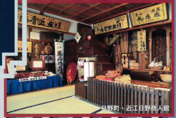
日野町・近江日野商人館