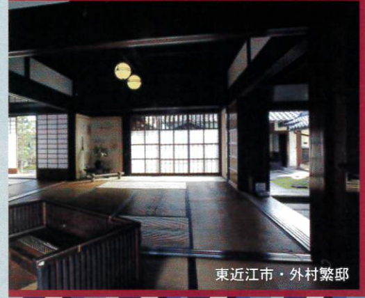
東近江市・外村繁邸