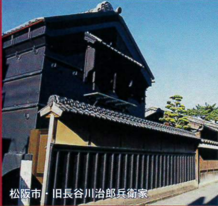
松阪市・旧長谷川治郎兵衛家