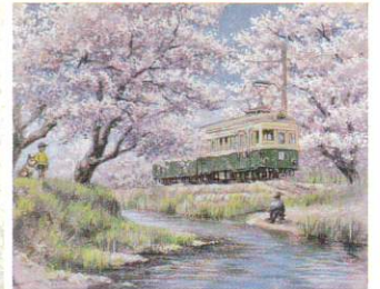
棚町宜弘「お花見電車」