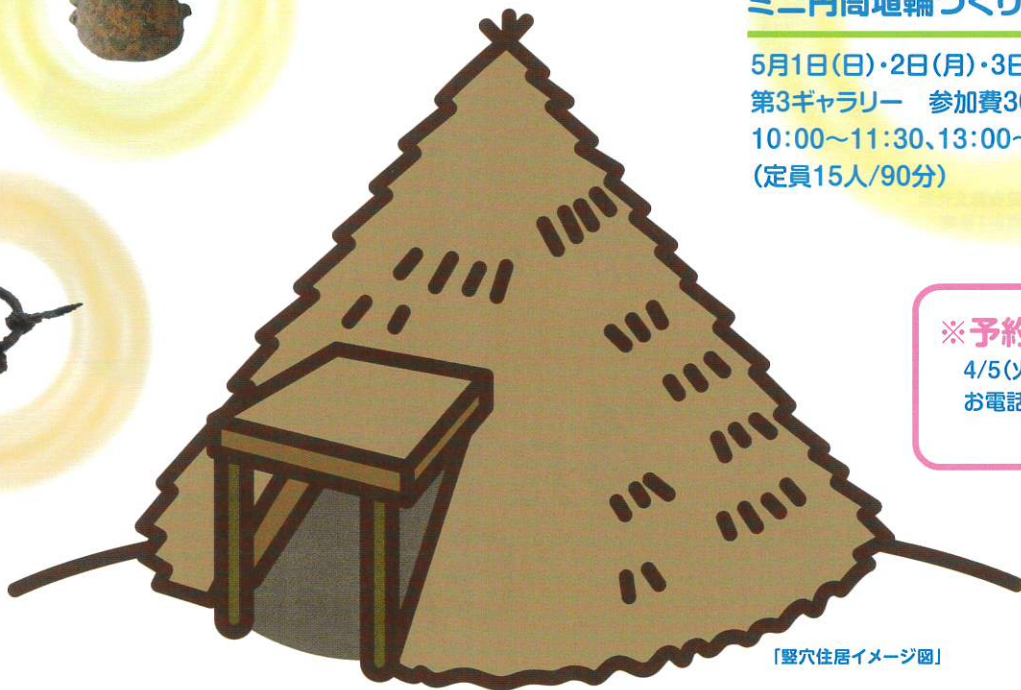
「竪穴住居イメージ図」