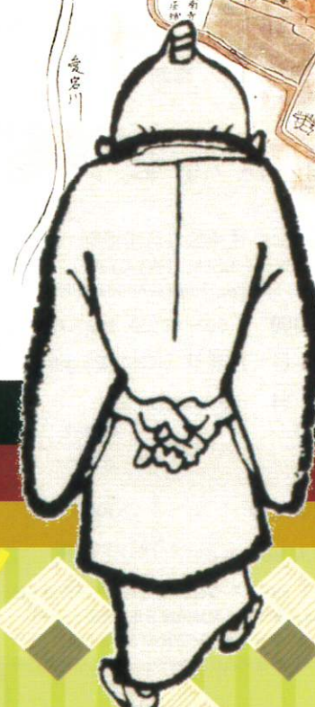
「松阪町図」本居春庭写