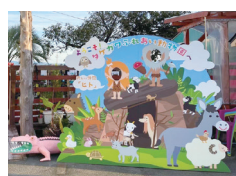
③タケガワふれあい動物園