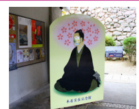
⑤宣長記念館 のりながりパネル