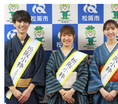
①松阪小粋(3人中1人でも可)