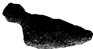
いしさじ しんでんちょういせき 石匙 (新田町遺跡)

今回展示しているものは、この松阪市から出土したものです。 縄文時代・弥生時代・古墳時代、多くの人たちは文字を使っていませんでした。 そこで、当時の生活の様子は現在まで残っているものから想像をします。 さあ、大昔のくらしをのぞいてみましょう。