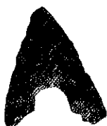
せきぞく 石鎌 (新田町遺跡)