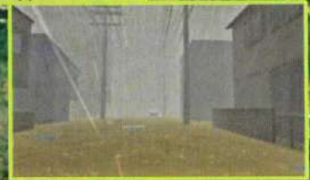
ダムの堤体内です