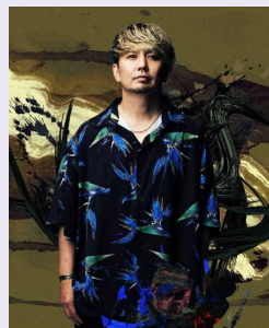
SHOCK EYEさん(湘南乃風) (ミュージシャン)