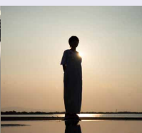
etsucoさん (ミュージシャン)