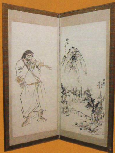
江戸～明治時代「山水図・蝦夷人物屏風」