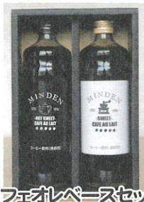
カフェオレベースセット 2,300円