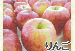
りんご 「アップルファームさみず」 から 8月下旬入荷予定