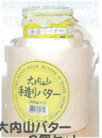
大内山バター 2個セット 3,330円