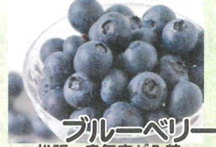
ブルーベリー 松阪・多気産が入荷