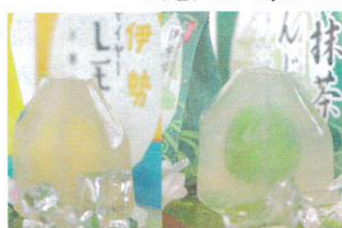
水まんじゅう 各 756円