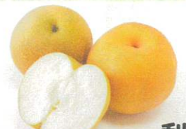
梨 地元松阪はもちろん、 香良洲、久居、伊賀からも入荷