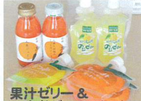
果汁ゼリー & 人参ジュースセット 3,400円