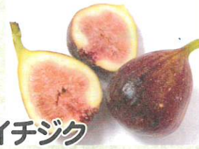
イチジク 地元松阪産