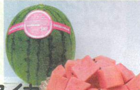
スイカ 極小シードの小玉スイカや 大玉スイカなど...