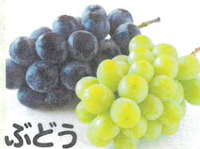
ぶどう 巨峰、安芸クイン、 シェインマスカット など...