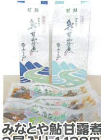
みなどや鮭 白露煮 3尾入り 1,138円 5尾入り 1,830円