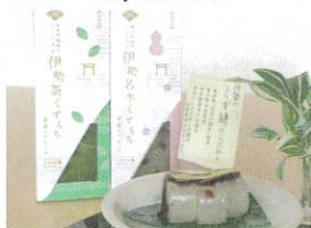
伊勢くずもち 各 720円 (すべて税込)