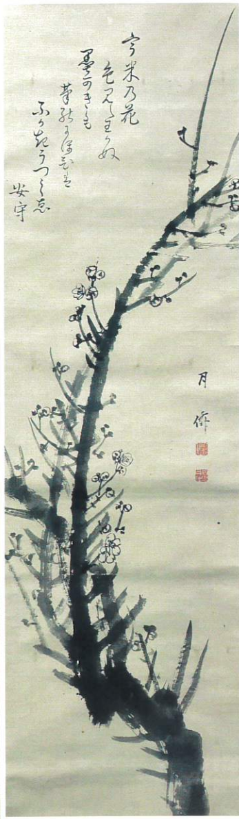
「梅図」月僊画安守賛 (本居宣長記念館蔵)