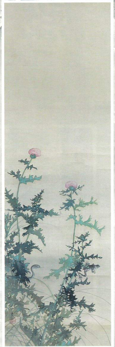
「薊に蛇と蛙図」殿村小霞画(個人蔵)