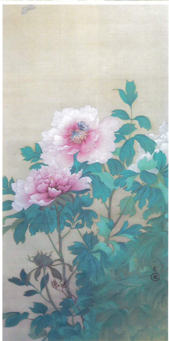
「牡丹に蝶図」殿村小霞画(個人蔵)