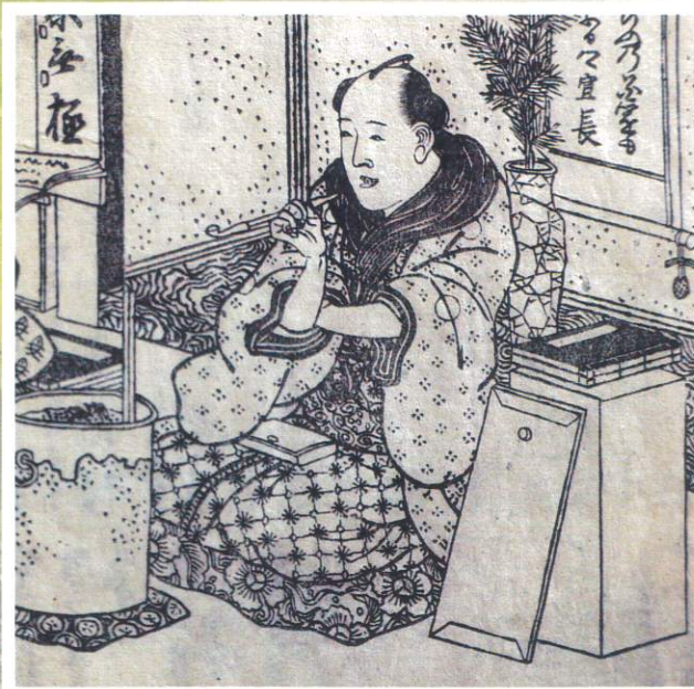
「犬夷評判記」より殿村安守(石水博物館蔵)