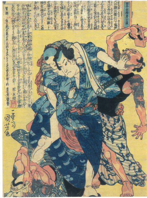
「曲亭翁精著八犬士随一犬江親兵衛」 歌川国芳画・櫛亭琴魚賛(個人蔵)