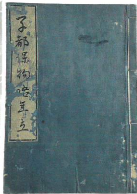
「宇津保物語年立」 殿村常久筆(個人蔵)