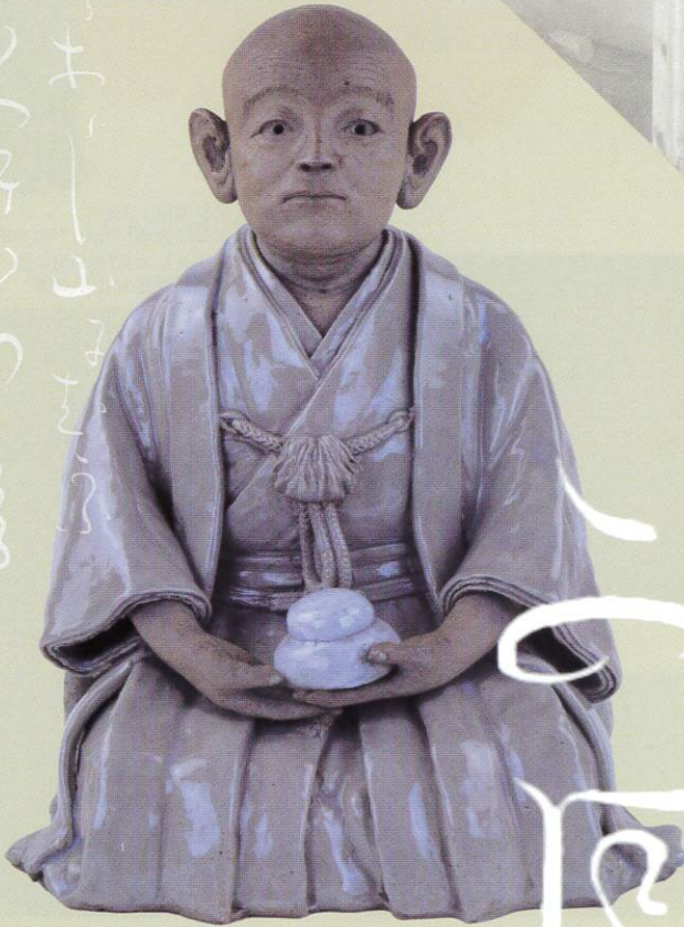
【餅絵葉書】餅会階下看板類陳列 大正頃